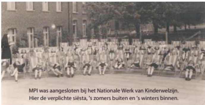
MPI was aangesloten bij het Nationale Werk van Kinderwelzijn. Hier de verplichte siësta, 's zomers buiten en 's winters binnen.