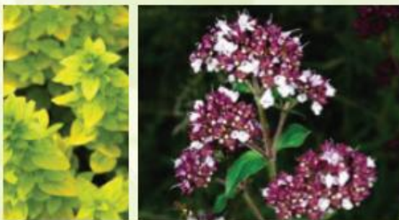
Links: Origanum vulgare 'Aureum'. Rechts: Origanum vulgare.

Bij de meeste tuinen krijgt Origanum het etiket van keukenplant. Als de grond het toelaat vindt men deze plant dan ook stevast terug in de moestuin. Spijtig want de sierwaarde is zeker niet te versmaden. Ook de aantrekkingskracht op bijen en vlinders is groot.